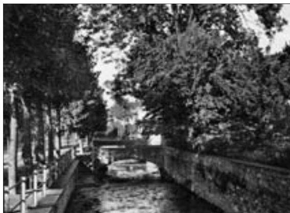
Die Warsteiner Hauptstraße – früher